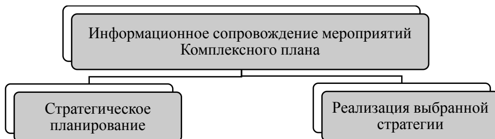
Рисунок 2 – Планирование информационного сопровождения мероприятий Комплексного плана

Основные принципы информационного сопровождения мероприятий Комплексного плана основываются на базовых принципах: